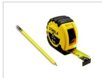
Рулетка и карандаш