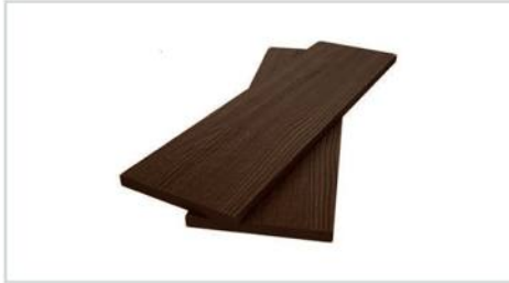
Подступенок/доска заборная 140x12